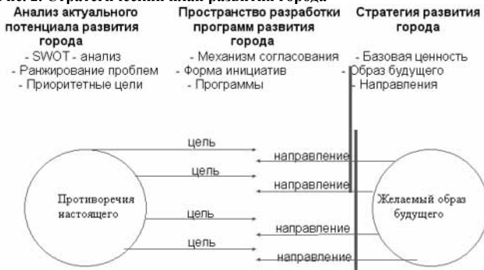
Рис. 2. Стратегический план развития города

В данной структуре стратегического плана можно видеть как стратегия задает общую логику развития города.